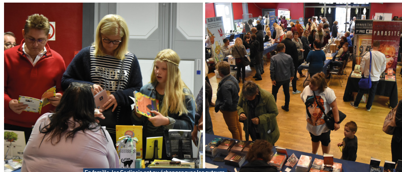
En famille, les Seclinois ont pu échanger avec les auteurs.

Vide-greniers de Burgault : il reste quelques places