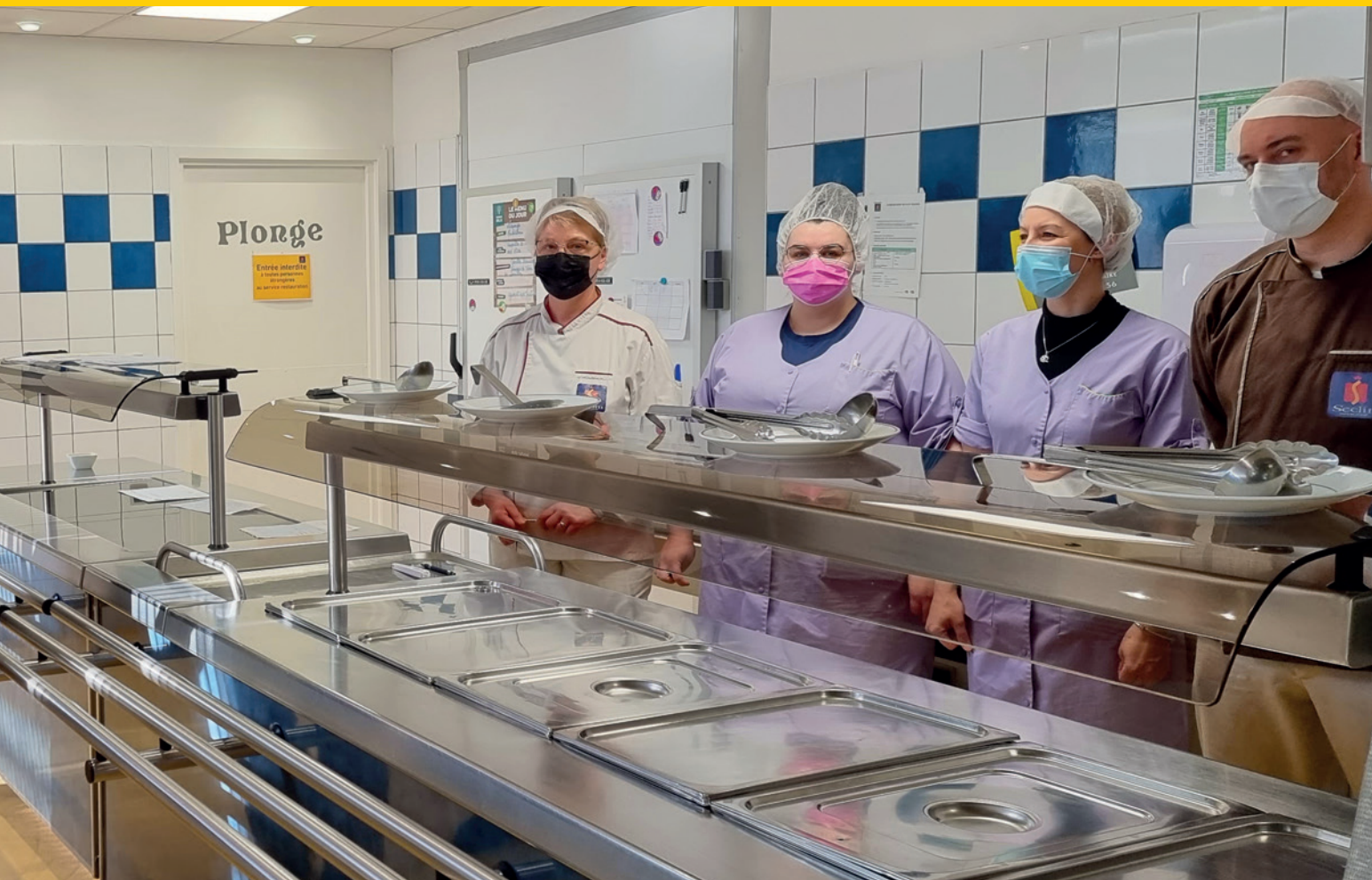
ur de la restauration scolaire, lors d'une visite au restaurant solaire Paul-Langevin.