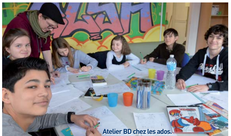
Atelier BD chez les ados.