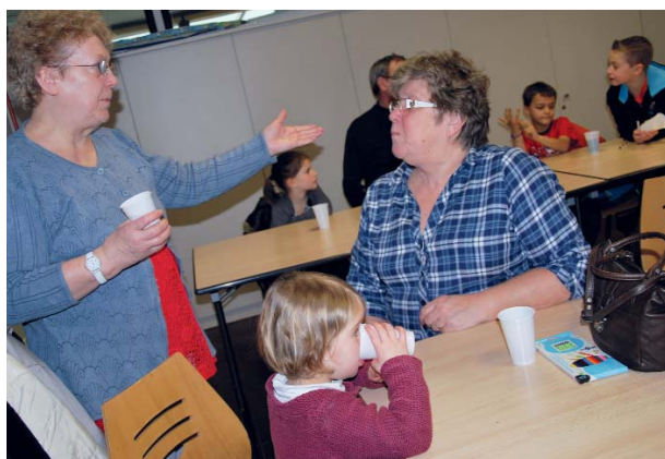
Un moment de détente intergénérationnel après l'effort de la dictée.