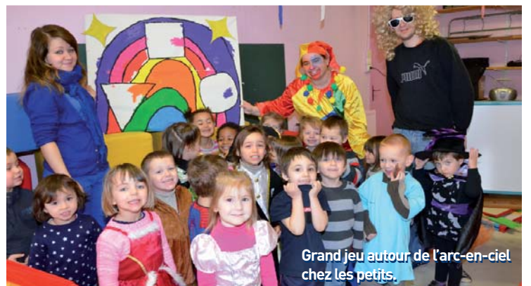
Grand jeu autour de l'arc-en-ciel chez les petits.