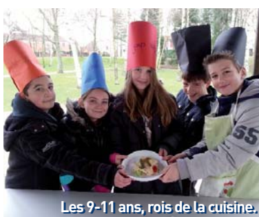
Les 9-11 ans, rois de la cuisine.