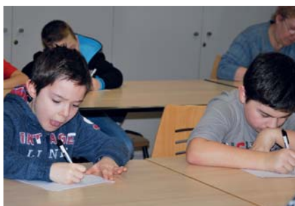
Des élèves très appliqués...