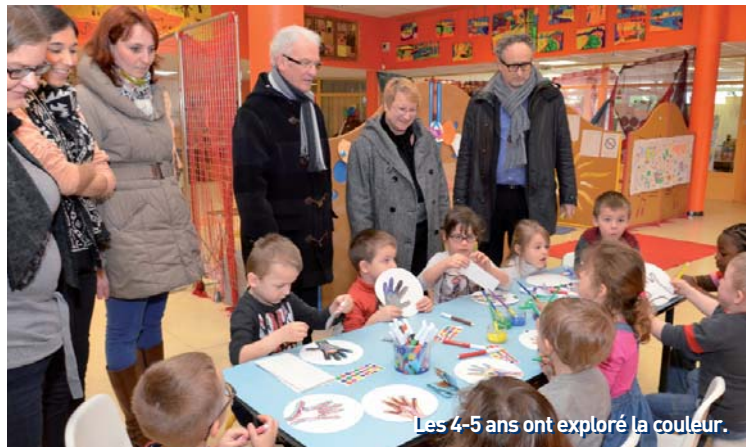
Les 4-5 ans ont exploré la couleur.

Côté sorties, Lille Neige, le musée de la poupée à Wambrechies ou encore la visite du musée de la BD à Bruxelles ont figuré au programme.