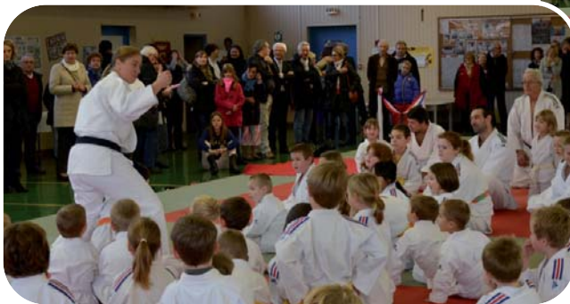
De nombreuses démonstrations sous le regard du public venu nombreux admirer ce nouvel espace municipal