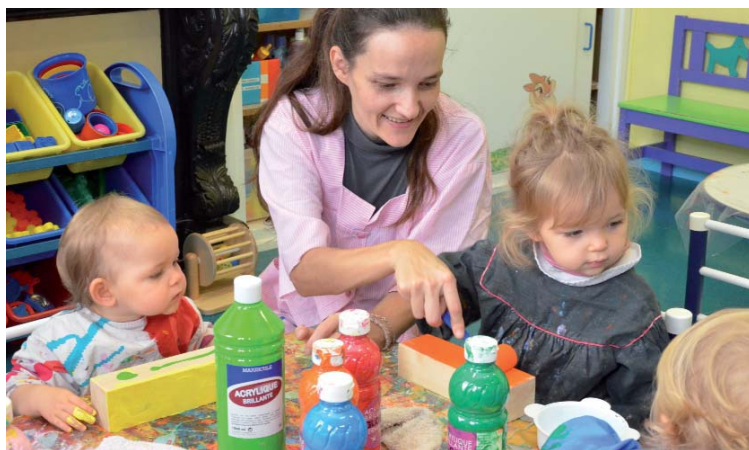
Atelier de décoration de briques en bois à la crèche municipale «Les P'tits Loups» pour affirmer les Droits de l'Enfant.

Le lendemain, le 20 novembre, pour la Journée Internationale des Droits de l'Enfant, le film «Le chemin de l'école» sera projeté aux enfants des mercredis de loisirs. Le 21 novembre, le conte musical urbain «La pluie d'or» sera donné à la salle des fêtes pour les CM1