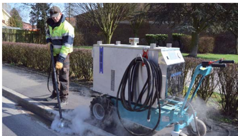
Les services espaces verts et propreté urbaine vont notamment utiliser ce désherbeur thermique à vapeur d'eau pour faire disparaître les herbes indésirables.

Quelques exemples pour illustrer ces pratiques. Dans les zones naturelles, un fauchage annuel permet aux plantes d'effectuer la totalité de leur cycle de vie pour se reproduire, une aubaine pour les insectes pollinisateurs comme les abeilles, les bourdons et papillons. « Les