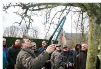
Le 16 mars, un atelier taille de fruitiers a été proposé par la Ville au public.

Samedi 16 mars, un atelier gratuit sur la taille des arbres fruitiers a connu le succès auprès du public avec 19 participants. L'occasion d'évoquer la gestion différenciée, l'utilisation préférable des méthodes naturelles et de prodiguer des conseils sur les bons gestes et les bonnes pratiques. Le prochain atelier proposé par la Ville, dédié à la découverte de l'apiculture, aura lieu le samedi 15 juin matin. Il est déjà possible de s'y inscrire en appelant le 03.20.62.91.31 ou en adressant un courriel à agenda21@ville-seclin.fr.