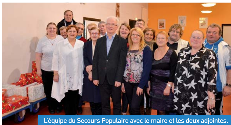
L'équipe du Secours Populaire avec le maire et les deux adjointes.

À noter pour les bénéficiaires que les Restos du Coeur de Seclin assureront une distribution plus conséquente les vendredis 28 décembre et 4 janvier (fermeture les 25 décembre et 1 er janvier).