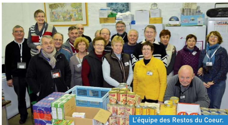
L'équipe des Restos du Coeur.

Les Restos du Coeur ont débuté la campagne d'hiver le 27 novembre. En cette période de fêtes, les bénévoles offriront aussi des jouets aux enfants. Le comité local du Secours Populaire a fait son Arbre de Noël le 9 décembre et offert des jouets aux enfants et des colis aux familles. Ces associations contribuent à faire vivre la solidarité envers les plus démunis, de même que l'association d'Aide aux Défavorisés Economiques (ADE), le Secours Catholique et Le Bol d'Air.