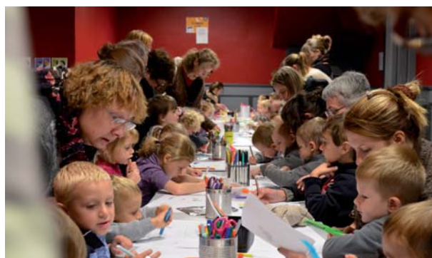
L'atelier d'animation qui a suivi la projection du matin a été très apprécié par les enfants.

Zdenek Miler. Ambiance poétique et féérique pour les petits, comme pour les grands. La projection s'est conclue par un atelier. Les petits Paul Grimault et Hayao Miyazaki en herbe ont pu réaliser un mini dessin animé coloré. L'après-midi, le film d'animation «Rebelle» a été projeté au jeune public.