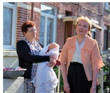
Des habitantes du quartier ont joué des saynètes sur la vie d'antan.