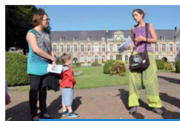
Visites ludiques proposées à l'Hôpital et à la Collégiale.

Un travail de fond qui a abouti à deux expositions présentées dans le nouveau Local Collectif Résidentiel du 1/2 rue Gernez-Rieux, et à l'Espace Communal Mouchonnière. Suite aux Journées du Patrimoine, un ouvrage sur la vie du quartier sera édité. Tous les témoignages sur la Mouchonnière d'antan sont les bienvenus !