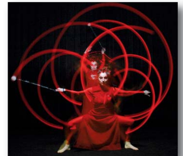
Dans l'après-midi : les Elec'twins.