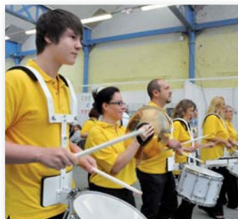
Inauguration à 11h avec l'Union Musicale.