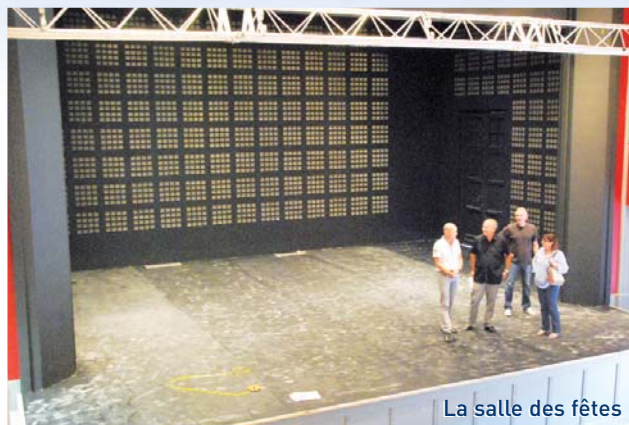
La salle des fêtes

Les clubs sportifs sont en pleine expansion. En concertation avec eux, des aménagements ont été décidés par la Ville. La salle Delaune a fait peau neuve avec un nouveau vitrage, des douches et vestiaires refaits. Elle accueille un dojo pour le judo avec une surface de tatamis bien augmentée. Le moving, la capoeira et la boxe américaine s'y entraîneront aussi. La salle Rosenberg sera désormais dédiée à l'archerie avec une nouvelle ciblerie et des locaux de rangement et de réunion. La musculation sera quant à elle installée à la salle Jesse-Owens où douches et toilettes seront refaits. Enfin, le club house du stade Jooris disposera d'une dalle béton avec un nouveau revêtement et, stade Jooris et Durot, les terrains de football ont été rénovés. Budget : 190.000 €.