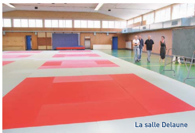
La salle Delaune