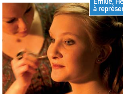
En coulisse : stress ou concentration ?