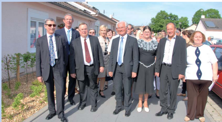
Le 6 mai, la Cité-Jardins réhabilitée a été inaugurée. De nouveaux logements ont aussi été livrés en cours d'année à la Résidence du 8-Mars (La Mouchonnière), au Clos Durot et route de Templemars (Burgault).