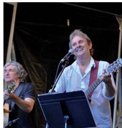
Le 26 juin, plus de 5.000 personnes ont assisté au concert de Murray Head lors de la Fête de la Ville.