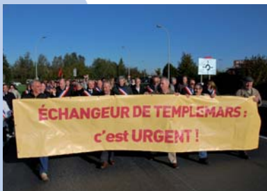
Le 15 octobre, élus et habitants ont manifesté pour demander un échangeur sur l'A1 à Templemars.