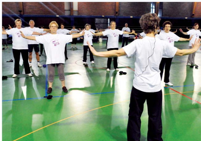
La salle Jesse-Owens a reçu plus d'une soixantaine de personnes à l'occasion d'un atelier dédié à la gymnastique volontaire. De quoi garder sourire et vitalité.

semaine, des ateliers sportifs et gastronomiques, des débats et rencontres sur la santé, des films, du théâtre, des dépistages et des balades santé (etc.) ont été programmés.