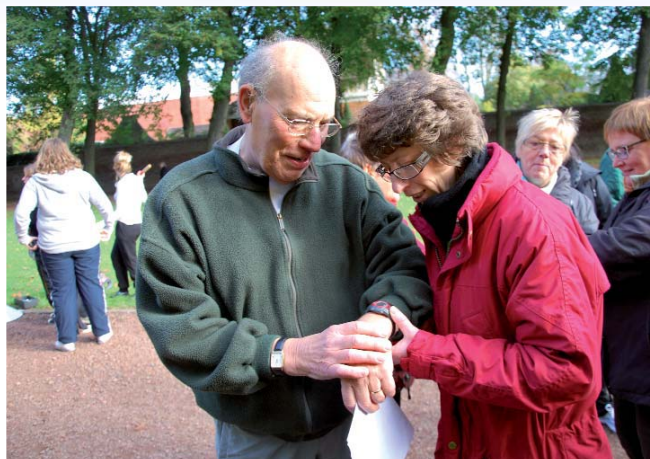
Des balades ont été proposées. À vélo, à pied. L'occasion de découvrir Seclin, Carvin et Houplin-Ancoisne. Mission ici à Seclin avec l'Acti'March : gérer le rythme de son coeur.