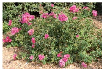
Le paillage limite l'arrosage et prévient les herbes indésirables.