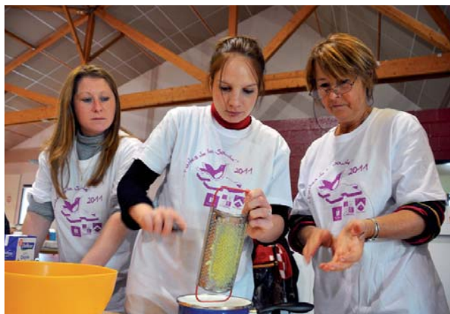
Le rendez-vous cuisine proposé par l'atelier de paroles, dans la salle Ronny-Coutteure, a offert l'occasion aux mamans de se lancer dans la création de petits plats bios et goûteux.