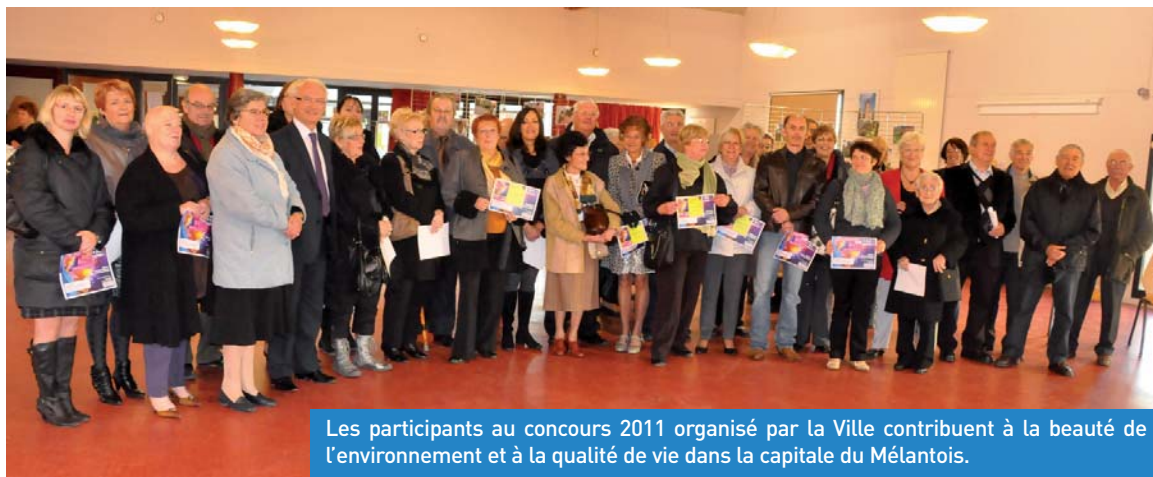
Les participants au concours 2011 organisé par la Ville contribuent à la beauté de l'environnement et à la qualité de vie dans la capitale du Mélandois.

Samedi 22 octobre, salle Ronny-Coutteure, les participants au Concours des Maisons Fleuries ont été mis à l'honneur. Pour sa part, la commune apporte un soin tout particulier à privilégier des méthodes respectueuses de l'environnement afin d'assurer l'entretien des espaces verts.