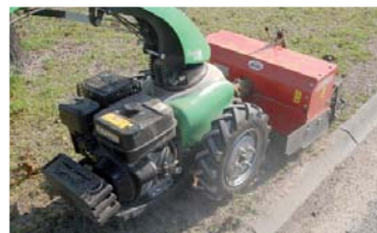
Désherbage mécanique. Une alternative aux produits phytosanitaires.