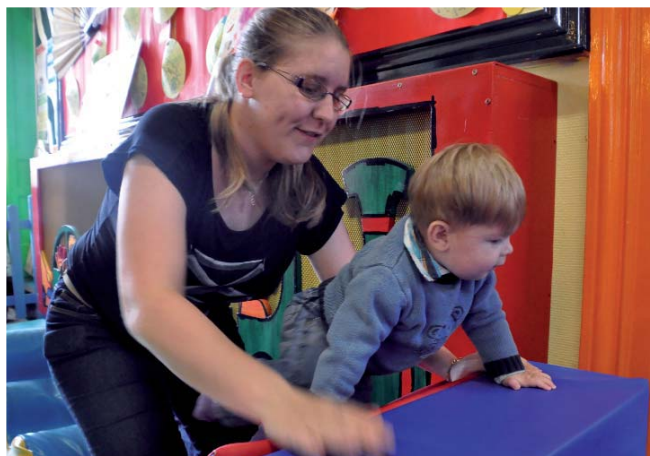
« Quand je serai grand, je serai aventurier ! » La crèche Les P'tits Loups a proposé aux enfants, ainsi qu'aux mamans, de tester un parcours géant dédié à la motricité.