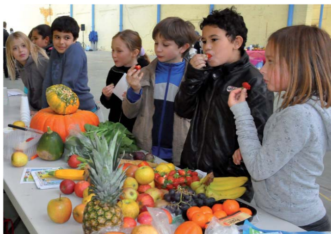
Les enfants des centres de loisirs de Seclin (ALSH) en ont profité pour découvrir les fruits d'ici et d'ailleurs lors d'une journée «activité sportive et alimentation».