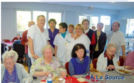
À La Source