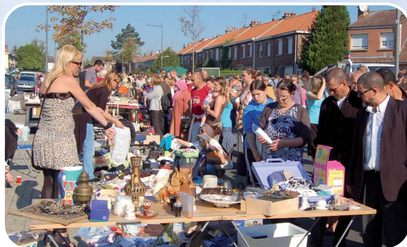
Avenue de la République (sur cette photo), rue de la Commune de Paris ou rue de Burgault, c'était l'occasion de chiner !

À cette occasion, un stand sur le projet de création du nouvel échangeur de Templemars a permis aux Seclinois de se renseigner. Près de cinq cents d'entre eux n'ont pas hésité à signer la pétition qui a d'ores et déjà dépassé les 1.000 signatures. L'occasion aussi d'inviter tout le monde à participer à la marche pacifique qui se déroulera le samedi 15 octobre à 10h au départ de la rue de la Commune de Paris (à côté de l'école Durot à Burgault).