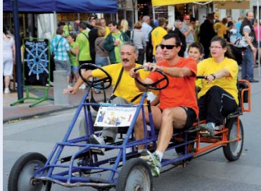
Le PPP et l'ÉSAT Malécot.