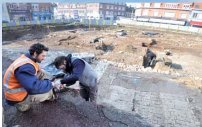
Un foyer de cheminée intégré à un habitat, entouré de pierres calcaires, vient d'être mis au jour cette semaine.