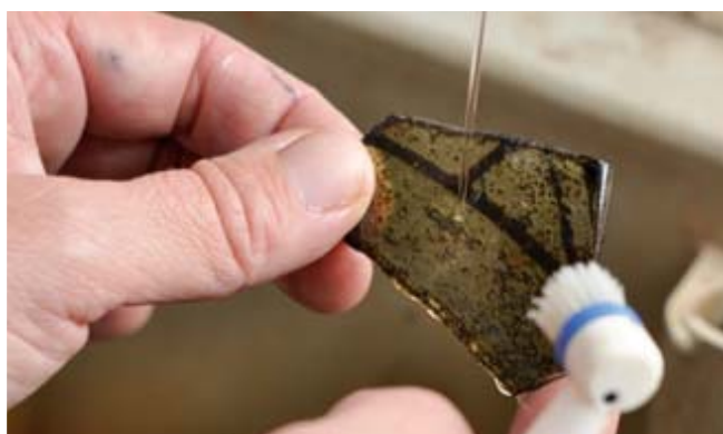
Un fragment de vitrail découvert dans le cimetière au pied de la collégiale, côté rue Abbé Bonpain.