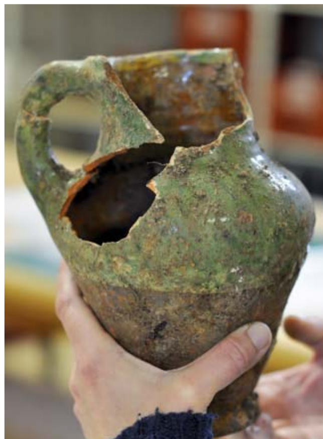
Une cruche du 17 ème siècle trouvée sur le site.