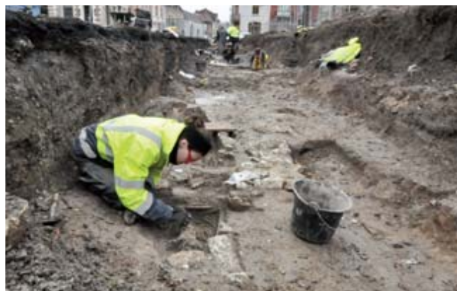
Tombe du bas Moyen Âge en cours de fouille.