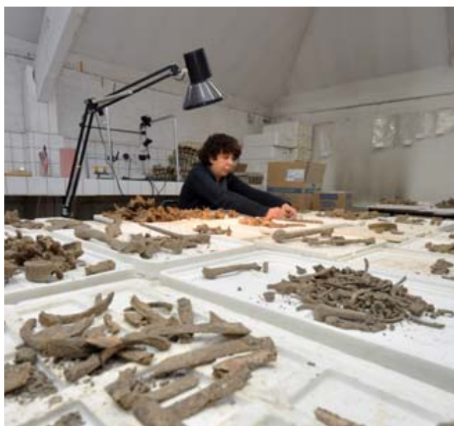
Au laboratoire, tous les éléments mis au jour sont répertoriés.