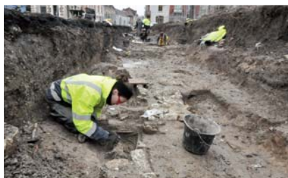
Tombe du bas Moyen Âge en cours de fouille.