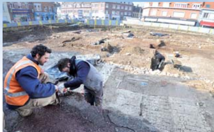
Un foyer de cheminée intégré à un habitat, entouré de pierres calcaires, vient d'être mis au jour cette semaine.