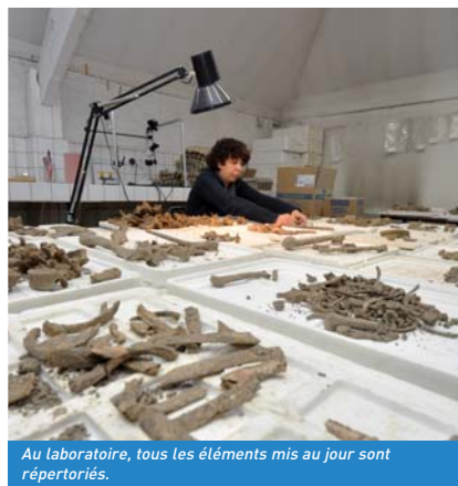
Au laboratoire, tous les éléments mis au jour sont répertoriés.