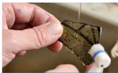
Un fragment de vitrail découvert dans le cimetière au pied de la collégiale, côté rue Abbé Bonpain.