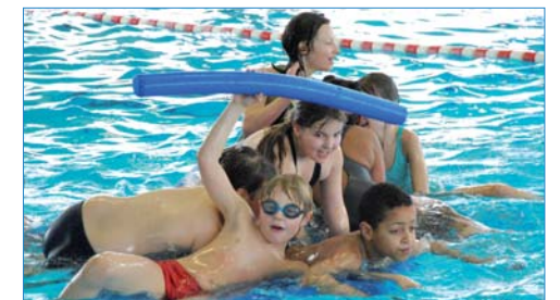
Les tarifs abordables demandés aux familles pour les accueils de loisirs (ici, en février 2011), les restaurants scolaires... : des atouts soulignés par les élus.

Comme chaque début d'année, les élus du conseil municipal évoquent les orientations budgétaires de la Ville. Vendredi 18 février, le débat démocratique a été riche et dense. Dans un contexte de réforme des collectivités qui se traduit par le gel des dotations de l'État et la suppression de la taxe professionnelle, la Ville de Seclin réussit à maintenir le cap par une bonne maîtrise des dépenses (+ 0,5%) et des recettes ponctuelles, comme l'augmentation des droits de mutation (signe de la relance du marché immobilier), qui portait l'excédent 2010 à 6,9 millions d'euros contre 6,3 millions en 2009. Finalement, le 25 mars, lors du vote du budget pour 2011, la majorité municipale proposera donc de maintenir les taux d'imposition.