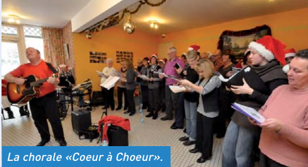
La chorale «Coeur à Choeur».