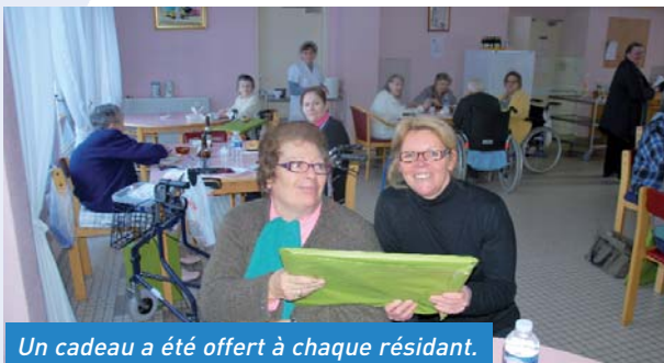
Un cadeau a été offert à chaque résidant.