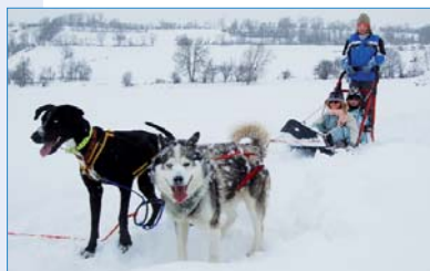
Balade en chiens de traîneau lors des classes de neige en 2010.

Le budget des classes de découverte à la montagne a été adopté par les élus du conseil municipal. Un effectif prévisionnel de 107 élèves de CM2 partira à Ristolas dans les Hautes-Alpes du 30 janvier au 11 février. Le coût unitaire pour la Ville est de 874,54 euros par enfant, alors que la Ville ne demande qu'un peu plus de 170 euros aux parents.