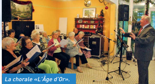
La chorale «L'Âge d'Or».