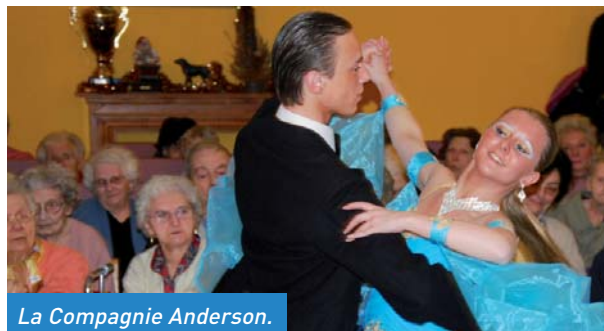
La Compagnie Anderson.