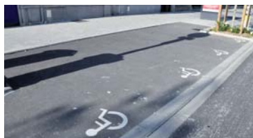
Place de parking longitudinale pour un véhicule, rue Roger-Bouvry.

De nouvelles places de stationnement réservées aux personnes à mobilité réduite ont été créées sur l'axe Hentgès-Bouvry. Les places longitudinales sont plus larges pour sortir aisément du véhicule : trois sont situées respectivement près de l'Hôtel de Ville, près de l'Office de Tourisme et à hauteur du 56 rue Roger-Bouvry. Deux emplacements ont par ailleurs été créés place Paul-Éluard (accès par le portique depuis la rue Roger-Bouvry), et une place se trouve chemin du Bois-Durand près de l'Immaculée Conception. Accessible uniquement aux automobilistes munis d'un macaron GIG/GIC.