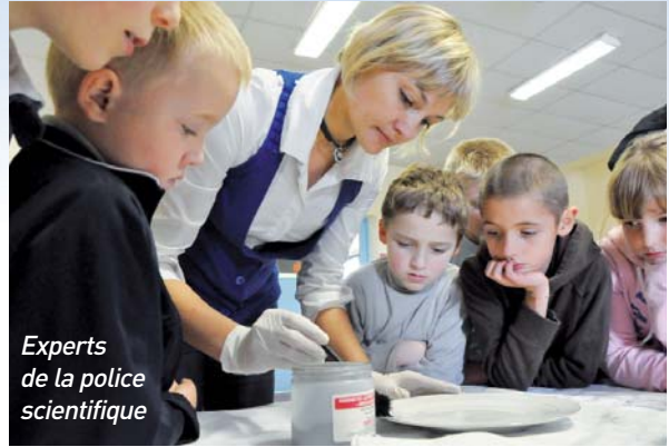
Experts de la police scientifique