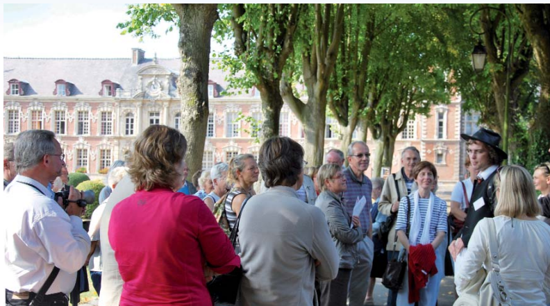
L'hôpital Notre-Dame pourra être visité lors des journées du patrimoine (comme ici en 2009). Il accueillera des expositions et des artisans tout le week-end.

Lors des Journées du Patrimoine, les 18 et 19 septembre, vous pourrez visiter les monuments de la ville et assister à des animations. Accès libre.