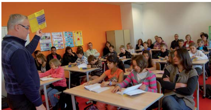
Au collège Jean-Demailly, l'accueil des élèves de sixième accompagnés de leurs parents. Explications données sur le carnet de liaison.

Au collège Jean-Demailly, la première journée était réservée à l'accueil des sixièmes. Les parents étaient invités lors de la matinée. Le maire a assisté à cette rentrée. Le collège a mis en place une charte qui précise les droits et devoirs des élèves et invite les parents à suivre la scolarité de leur enfant pour contribuer, avec l'équipe éducative, à la réussite de chacun.