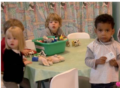
Les petits ont découvert leur nouvel environnement à l'école La Fontaine.

À la maternelle La Fontaine, les petits ont effectué leur première rentrée. Après quelques instants d'émotion, ils ont commencé à trouver leurs marques.