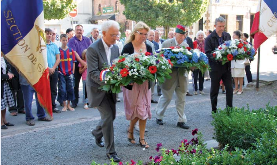
Des gerbes de fleurs ont été déposées à la stèle des victimes de la Potasserie, rue Roger-Bouvry, puis au Monument aux Morts par les élus de la Ville et les associations patriotiques.