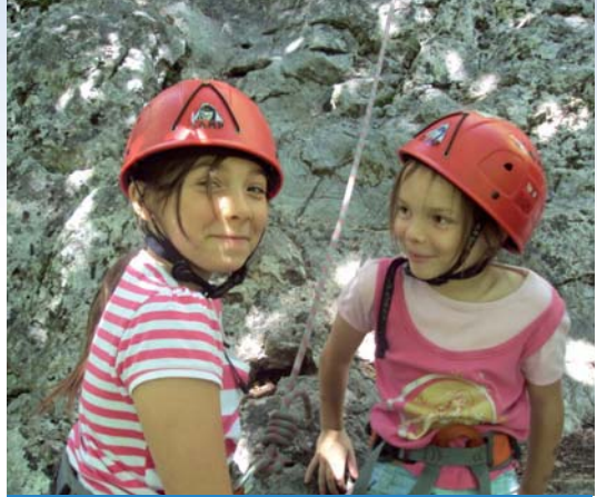
Séance d'escalade au centre de vacances Le Prariand en Haute-Savoie pendant le séjour du mois d'août.