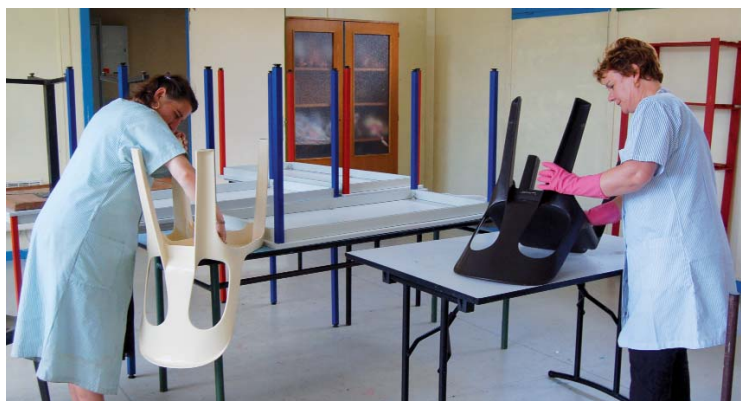
Avant la rentrée, les agents de la Ville s'affairent aux derniers préparatifs dans les écoles. Comme ici à l'école primaire Paul-Langevin.

Cet été, des investissements ont également été effectués dans les équipements sportifs. Le terrain d'honneur du stade Henri-Jooris a ainsi bénéficié d'une belle métamorphose pour accueillir les matchs de Division Honneur