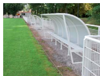
Le terrain d'honneur du stade Jooris a été aménagé cet été.

Les peintures intérieures de la bibliothèque municipale Jacques-Estager ont été effectuées en régie par le personnel du Centre Technique Municipal. D'autre part, des nouvelles places de stationnement et un arrêt de bus ont été créés par LMCU et Transpole près du collège Jean-Demilly. Au final, de quoi débiter la rentrée dans de bonnes conditions dans les écoles et dans les équipements communaux.