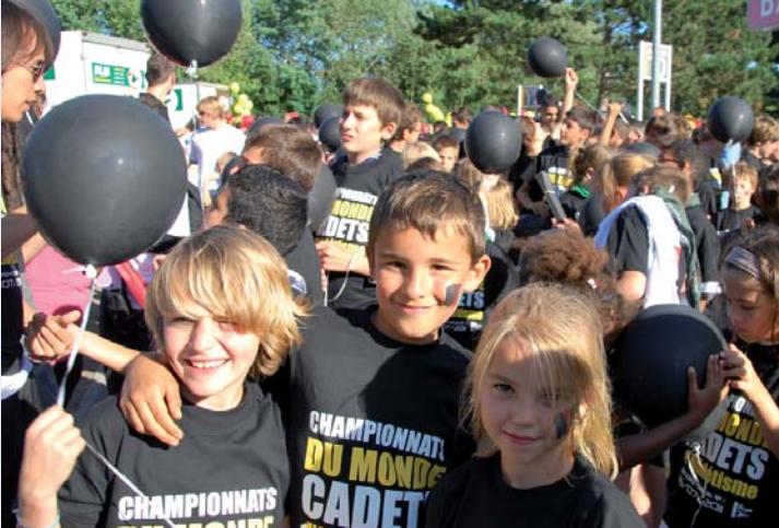
58 jeunes des Accueils de Loisirs ont participé à la cérémonie d'ouverture du Meeting d'Athlétisme à Villeneuve d'Ascq le 24 août.