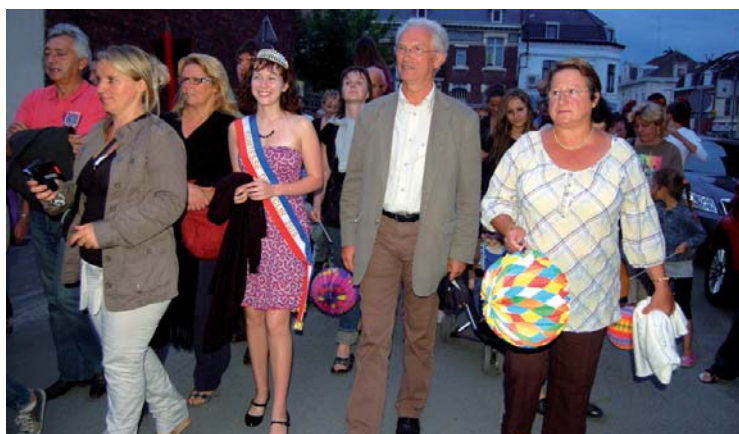
Juste derrière la nouvelle géante Marguerite, on pouvait croiser dans le défilé notre Comtesse de Seclin 2010, accompagnée du maire et des élus.