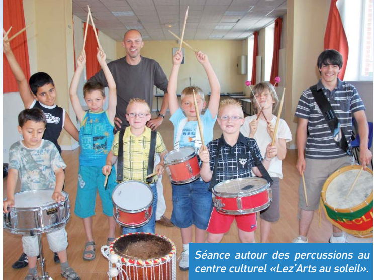
Séance autour des percussions au centre culturel «Lez'Arts au soleil».