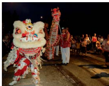
La danse du lion et du dragon : un petit air de Chine à Seclin.

Les lampions, ça sert à tout, même à se déguiser. La palme du sourire à ce Seclinois fakir à ses heures !