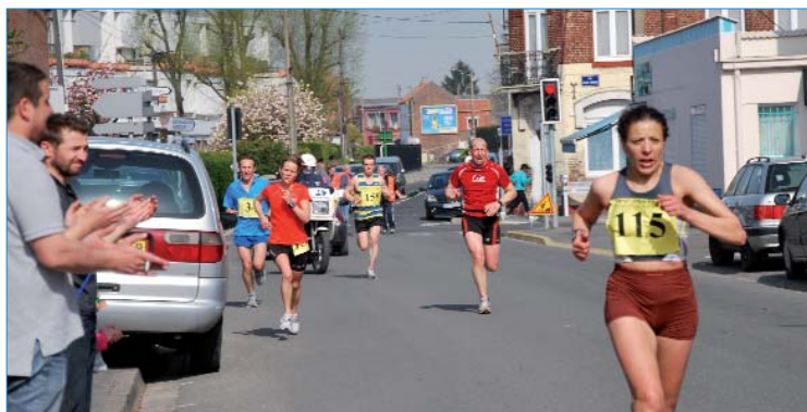
Dans la course reine du 10 km, le vainqueur a remporté l'épreuve en 30'48" et la première féminine a couru la distance en 37'58".