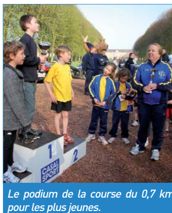
Le podium de la course du 0,7 km pour les plus jeunes.