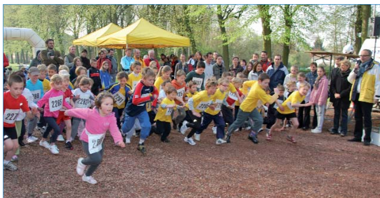
La Seclinoise, c'est 4 courses. Des plus jeunes aux vétérans, garçons et filles, chacun y trouve son compte. Sous les encouragements du public.

Ce dimanche 25 avril, vous êtes convié à marcher à votre rythme lors du Parcours du Coeur. À l'invitation de la Ville, de Seclin Rando, de l'Office de Tourisme et du Don du Sang (qui proposera de prendre la tension artérielle). Au choix, trois parcours le long du canal de Seclin : 5, 8 et 10 km. Inscriptions de 9h30 à 11h, salle de Javelot, parc des Époux Rosenberg. Accès libre et gratuit. Ravitaillement. Diplôme et Tee-Shirt à chaque participant.