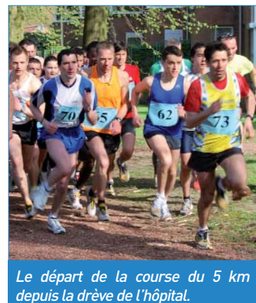
Le départ de la course du 5 km depuis la drève de l'hôpital.