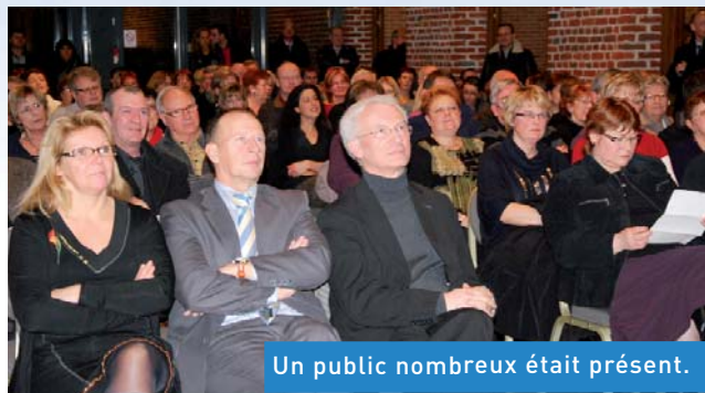
Un public nombreux était présent.