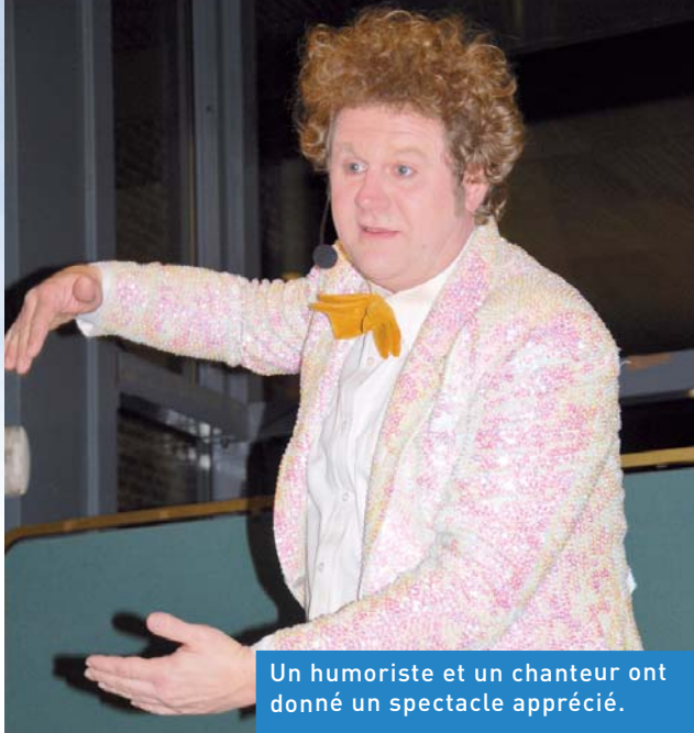
Un humoriste et un chanteur ont donné un spectacle apprécié.