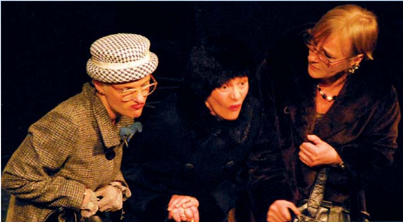
Une trentaine de saynètes pour souhaiter de « Joyeuses Condoléances ».