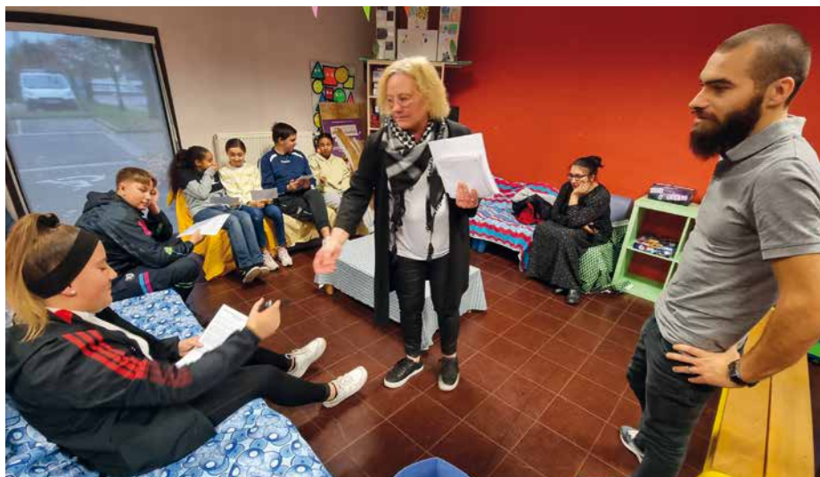
L'un des nombreux temps forts du Festisol : l'Escape Game.

chauds offerts ensuite aux personnes qui en ont le plus besoin en coopération avec le Secours Populaire et Liens Essentiels.