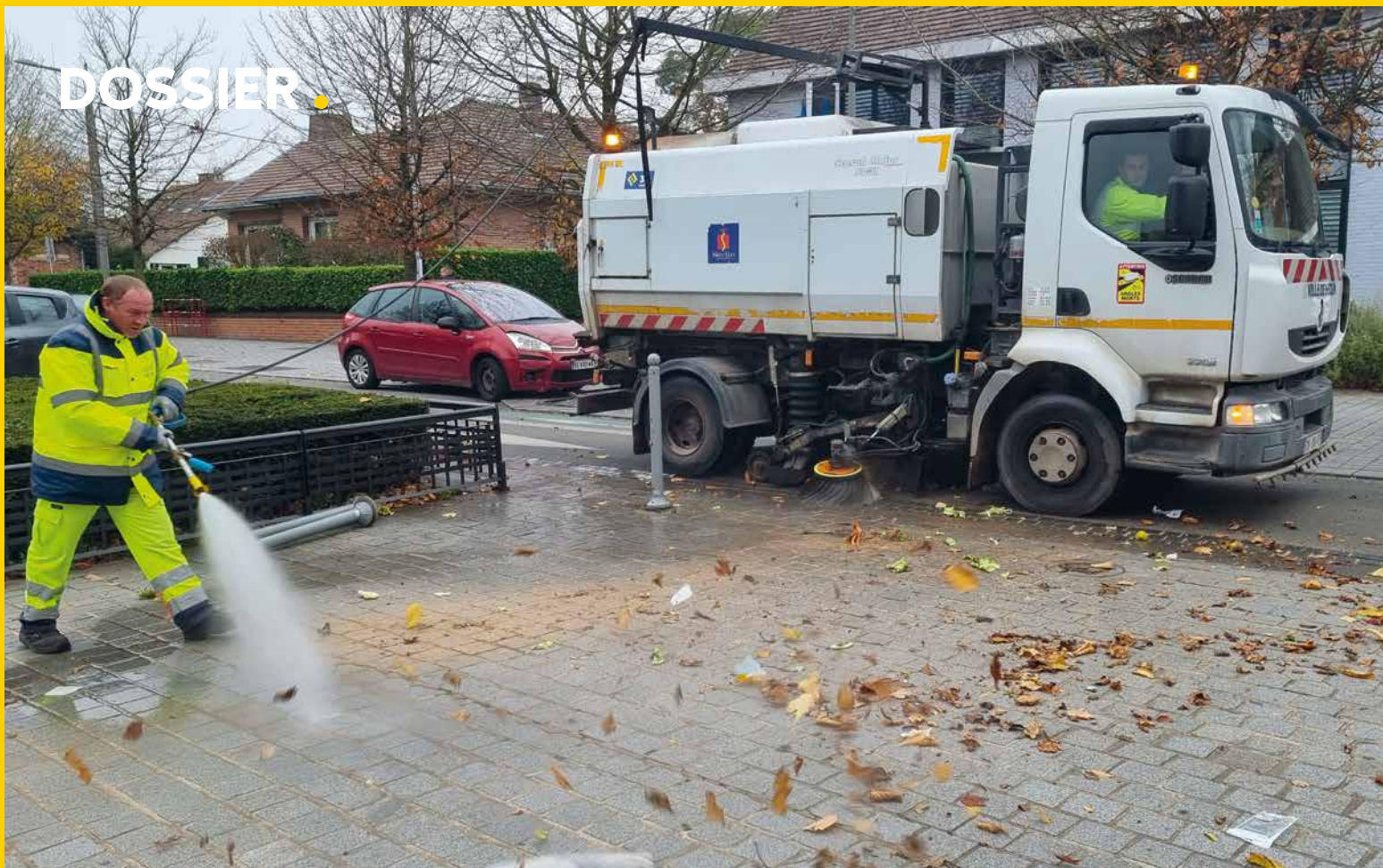
La balayeuse municipale passe régulièrement comme ici après le marché.