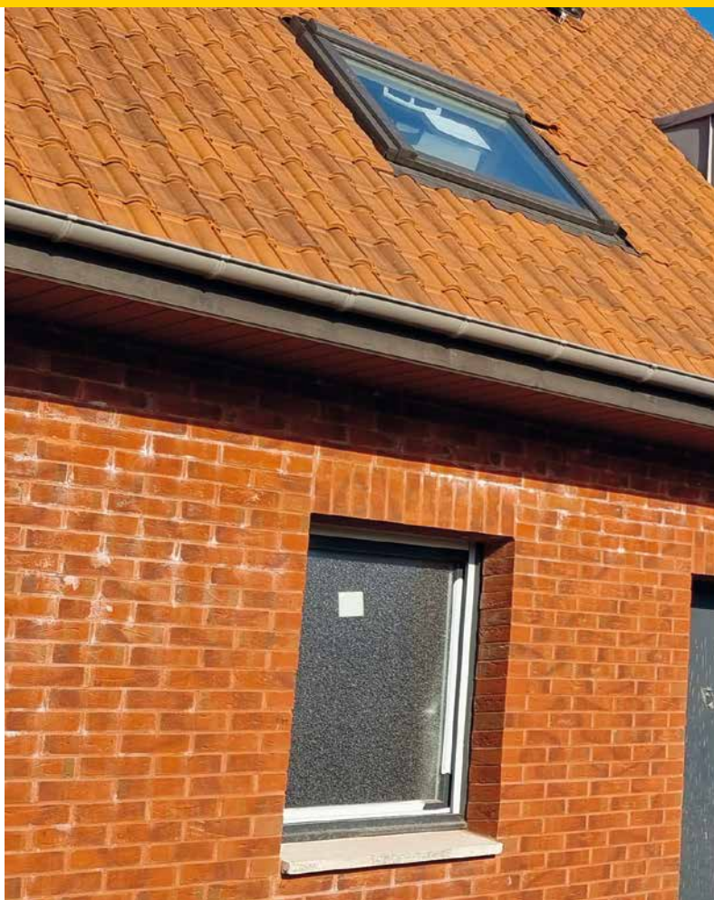
La Résidence Martha-Desrumaux sort de terre. Les 16 premiers logements seront livrés ce mois-ci.

Dans les autres quartiers, notons la rénovation des immeubles Partenord boulevard Hentgès, avec les parkings et les locaux