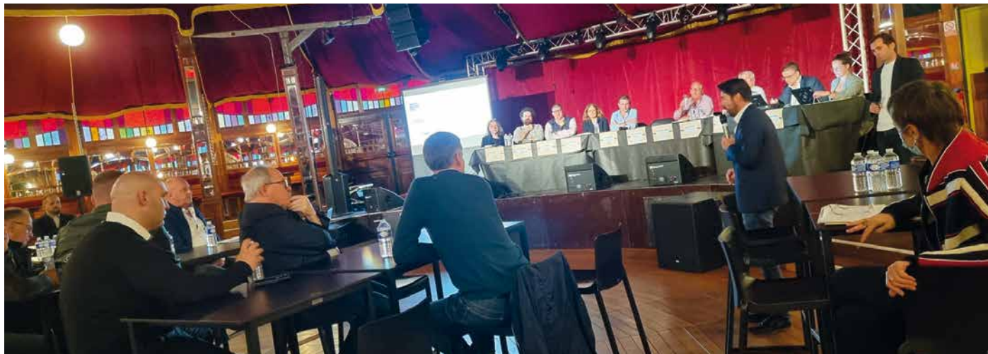
L'association des propriétaires de la zone (ASL) et l'association du parc commercial de Seclin (APCS) tenaient leurs assemblées générales respectives au Trianon.