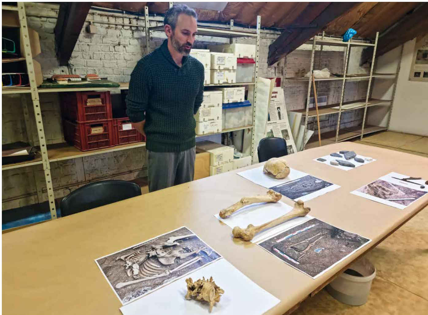
Des découvertes essentielles pour mieux connaître l'Histoire de Seclin.