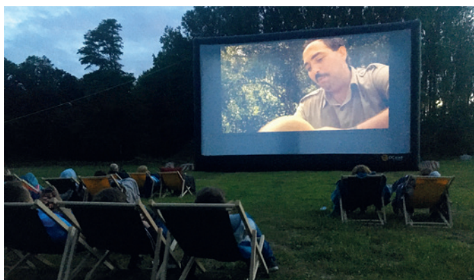
Le film « Jurassic Park » a été projeté en plein air le 3 juillet 2021 au parc de la Ramie.

Mais le rayonnement est bien plus large que les festivités. « Quand on transforme la salle des fêtes en salle de spectacles avec de vrais fauteuils, de vraies loges, la reconquête du balcon, et une résidence d'artiste, c'est aussi des retombées en rayonnement pour Seclin. Ou encore quand on s'apprête à réaménager les entrées de ville, c'est pour renforcer l'identité et l'image de notre ville ».