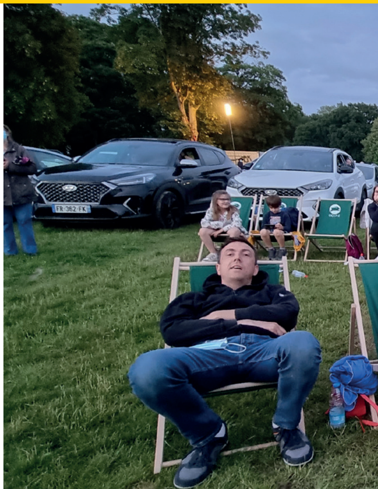
Grande réussite dans le parc de la Ramie le 3 juillet 2021 : le ciné de plein air peuplé d'étranges créatures.

En route maintenant vers le rayonnement version 2022 alliant le sport, la culture, les associations... autour d'événements traditionnels ou totalement nouveaux, qui feront la renommée de Seclin, son identité, et son prestige. La boîte à idées est ouverte : c'est parti pour de nouvelles aventures !