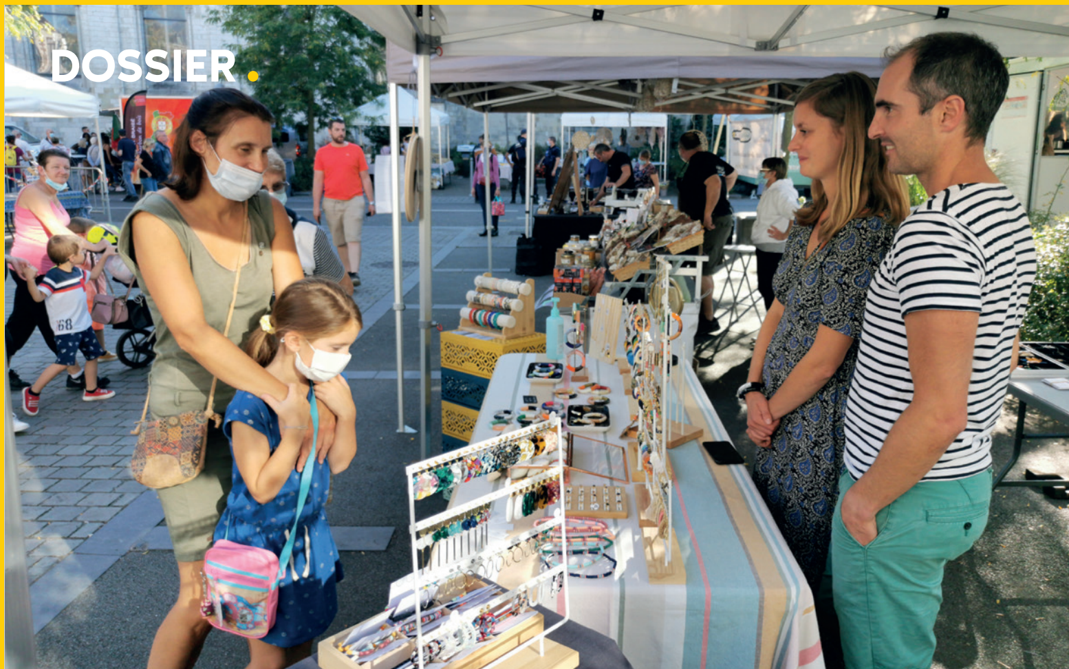
Le Marché Local et Artisanal de la Collégiale a attiré la foule en centre-ville.