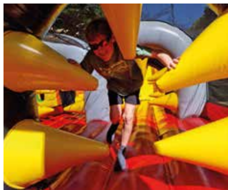
« The Big », plus grande structure gonflable d'Europe

Un vrai village médiéval vous accueillait sur la place du Général-de-Gaulle. Avec vente de denrées et d'objets liés au Moyen Âge. C'est aussi là que l'UCASS (Union des Commerçants) tenait un stand particulièrement alléchant avec cochon grillé ! Des spectacles ont attiré un monde