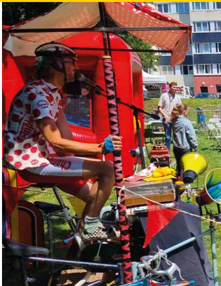
La Fête du Jeu à la Mouchonnière : un des événements co-construits avec les habitants.

Faire de La Mouchonnière un quartier à part entière où les Seclinois(es) de tous les autres quartiers ont envie de venir,