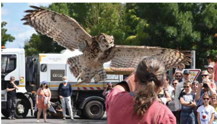
Le spectacle de fauconnerie : un immense succès !

fou, notamment la démonstration de fauconnerie.