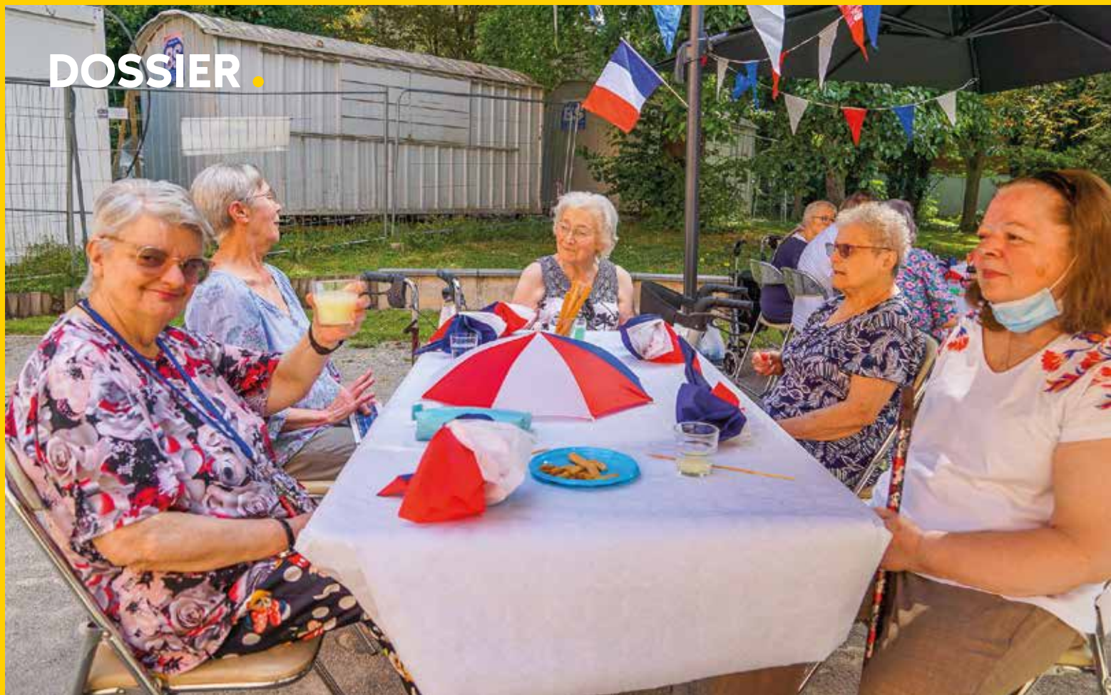
Le 13 juillet, les résidents de Sacleux ont partagé un apéritif républicain.