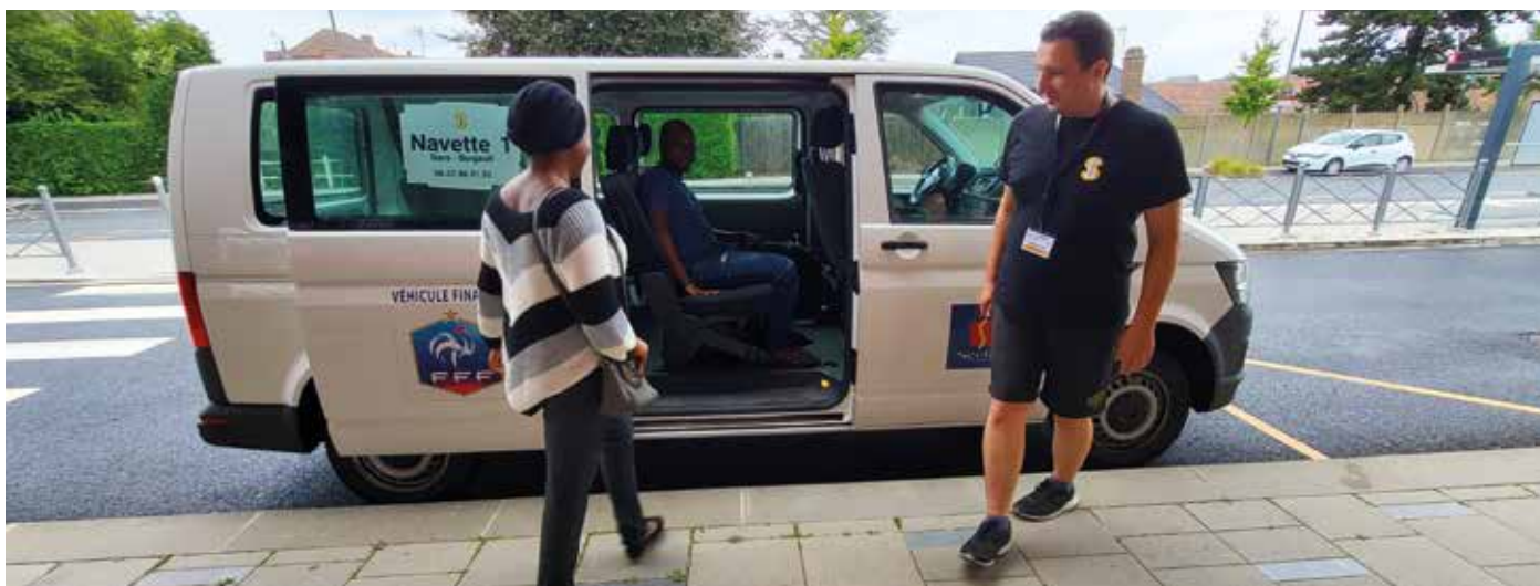
Les navettes opèrent une rotation toutes les 15 minutes entre la gare et la rue de Burgault.