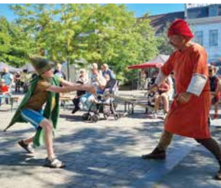
Village médiéval sur la place De-Gaulle

étourdissant ! Les associations seclinoises et des foodtrucks ont désaltéré et nourri les visiteurs. Les géants Harengus Junior, Marguerite de Flandre de Seclin, et Jeanne de Flandre de Marquette ont défilé en fin d'après-midi jusqu'à la Collégiale, emmenés par l'Union Musicale.