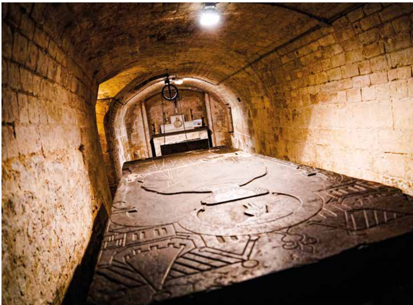
La crypte de la Collégiale Saint-Piat : un trésor à découvrir le 18 septembre.